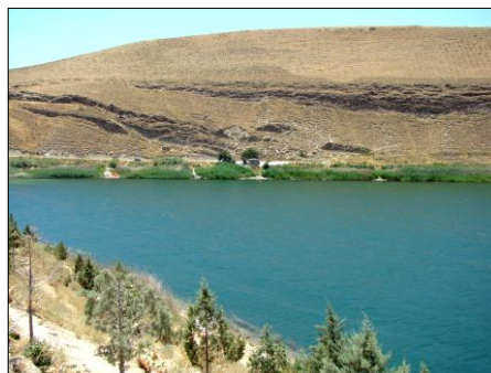
شکل ۲: نمایی از دریاچه بزنگان (سواحل و بقعه زیارتی گل بی بی) در شمال شرق کشور (شهرستان سرخس)، ۱۳۸۹

به طور کلی پتانسیل‌ها و جاذبه‌های منطقه گردشگری دریاچه بزنگان را می‌توان به صورت؛ جاذبه‌های توپوگرافیکی و زمین شناسی، پتانسیل‌ها و جاذبه‌های گیاهی و جانوری، پتانسیل‌های منابع آبی و جاذبه‌های فرهنگی - مذهبی و ویژه طبقه بندی و در نظر گرفت. در اطراف دریاچه دو رشته ارتفاع اصلی به نام‌های بزنگان و چهل کمان مشاهده می‌شود که از نظر توپوگرافی دارای واحدهای جاذب توریست مانند دامنه، مخروط افکنه و پایکوه می‌باشد. وجود پایکوه‌های بزنگان موجب خنکی هوا به خصوص در فصل تابستان می‌شود که چنین شرایطی باعث حضور گردشگران در این فصل می‌شود. بنابراین چشم اندازهای کوهستانی بزنگان در بخش جنوب و جنوب غربی دریاچه به دلیل نزدیکی به ساحل از نقاط قوت این محدوده گردشگری است. وجود غار بزنگان در جنوب دریاچه در مجاورت روستای بزنگان از دیگر جاذبه‌های گردشگری است که تقریباً در تمام ایام سال گردشگران، پژوهشگران و غارنوردان را از مناطق مختلف به سوی خود می‌کشاند.