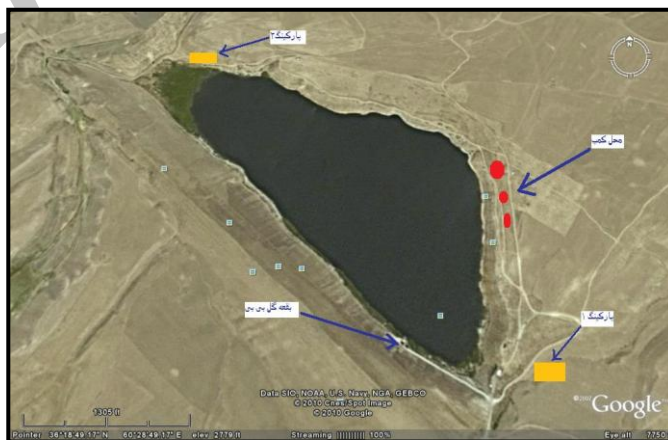
(قنبرزاده و بهنیا، ۱۳۸۹: ۲۱۸ و سایت گوگل ارث)